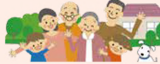
地域や人とのつながりを大切にしましょう

土器地区連合自治会総会 ◆日時：4月26日(土)13時半 ◆場所：土器コミュニティセンター ※駐車場は土器川河川敷です。