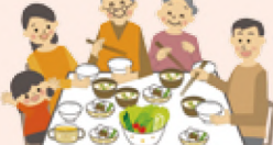
だれかと一緒に会話をしながら食事をしましょう