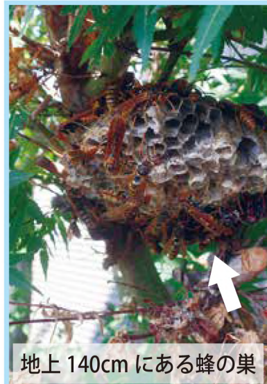
地上 140cm にある蜂の巣